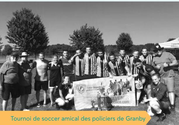
Tournoi de soccer amical des policiers de Granby