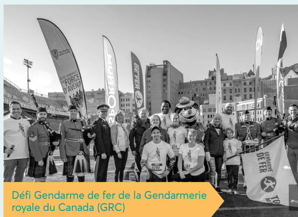
Défi Gendarme de fer de la Gendarmerie royale du Canada (GRC)