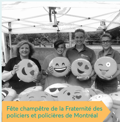
Fête champêtre de la Fraternité des policiers et policières de Montréal