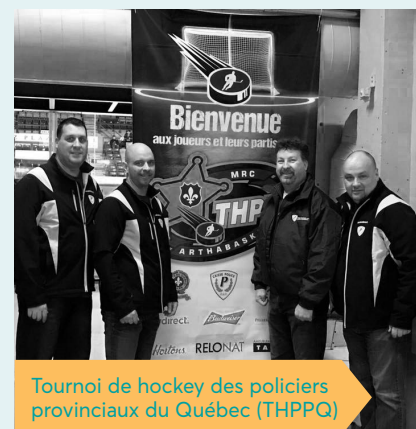
Tournoi de hockey des policiers provinciaux du Québec (THPPQ)