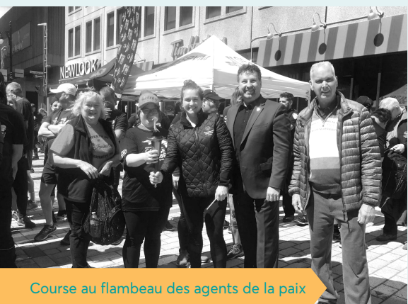
Course au flambeau des agents de la paix

En 2019, le Tournoi de hockey des policiers provinciaux du Québec (THPPQ) célébrait sa 44e édition. Au cours des dernières années, c'est une moyenne de 85 équipes formées de policiers et d'étudiants en techniques policières pour un total de 1500 participants qui ont pris part à cet événement d'envergure. Comme le veut la tradition, les équipes gagnantes et finalistes remettent leurs bourses aux organismes choisis par le comité organisateur. Depuis ses tout débuts, la Caisse réitère son engagement envers cette initiative sportive qui mobilise la communauté policière.