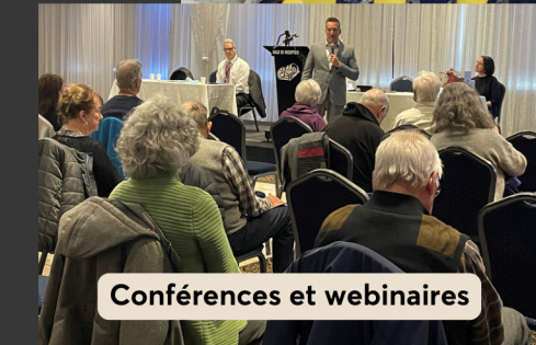
Conférences et webinaires