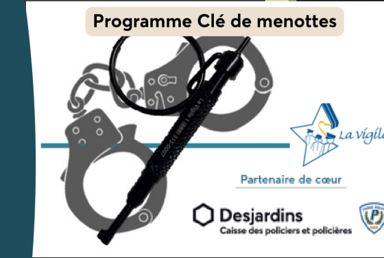
Programme Clé de menottes