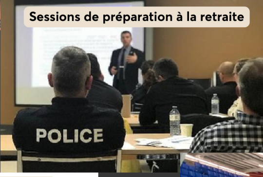
Sessions de préparation à la retraite