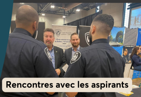
Rencontres avec les aspirants