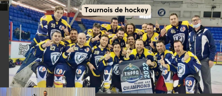
Tournois de hockey