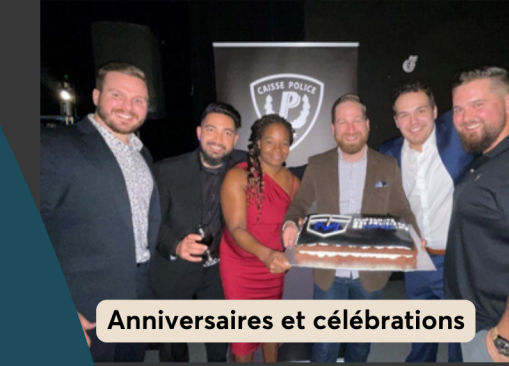
Anniversaires et célébrations