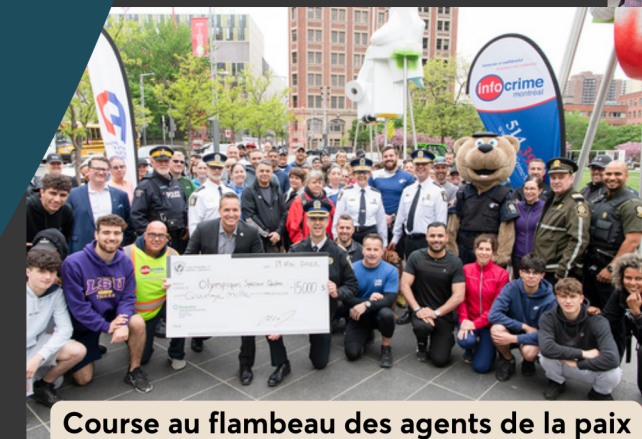
Course au flambeau des agents de la paix