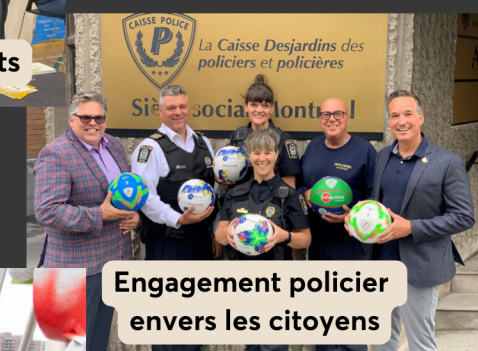
Engagement policier envers les citoyens